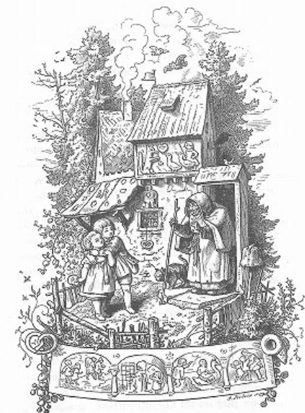
「Hänsel und Gretel / ヘンゼルとグレーテル」