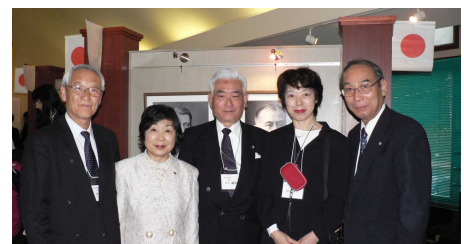
神戸・大阪・香川・奈良日独協会からの出席者