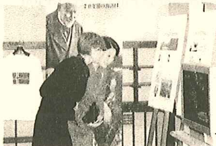
秋篠宮妃殿下ご鑑賞 平成20年10月15日、自由学園(池袋)

【展示期間】平成22年1月11日(月、祝) ~ 1月17日(日) 10:00 ~ 17:00