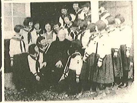
(上)昭和12年 右端は上智大学ホイヴェルス学長 (下)昭和12年 ノンニと大和学園(現聖セシリア)