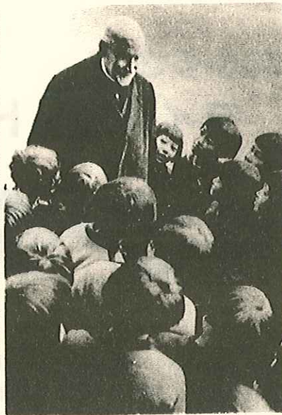
昭和13年 ノンニと帝塚山学院の生徒