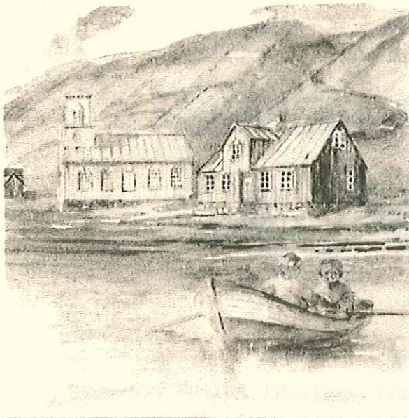
1914年「ノンニとマンニのふしぎな冒険」